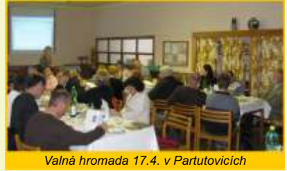
Valná hromada 17.4. v Partutovicích

MAS oslavila schválení SPL na Valné hromadě 17. dubna 2008 v Partutovicích, kde na přítomné čekalo občerstvení a živá hudba. Pak už se ale pustila do intenzivní práce na zahájení realizace SPL. Na prvním místě to bylo přijetí dvou nových zaměstnanců, kteří celou realizaci budou mít na starost. Dne 19.5.