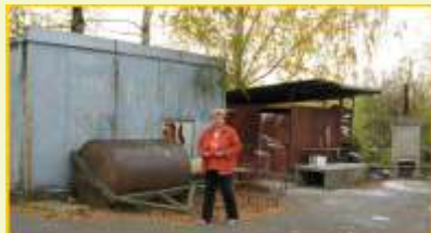
V Horním Újezdě vybudují nové zázemí sportovního areálu

Na jednání Programového výboru dne 30. října došlo ke zhodnocení průběhu Výzvy, své zprávy zde přednesli Manažer MAS, předseda Výběrové komise a externí poradce. Další intenzivní diskuse nad proběhlým prvním kolem Programu LEADER proběhla na Valné hromadě v Hranicích dne 4. listopadu 2008. Na těchto setkáních byly rozebrány úspěchy i nedostatky v průběhu celé výzvy a ukázalo se, že na základě zkušeností je třeba některé postupy či pravidla popsané v SPL či interních statutech vylepšit a upřesnit. Valná hromada proto pověřila Kancelář MAS k vyhlášení připomínkovací řízení, kde mohl každý člen MAS do předem připravených formulářů zaznamenat a zaslat své postřehy, náměty a připomínky k vybraným pasážím SPL, Fichím, které byly vyhlášeny, Statutům