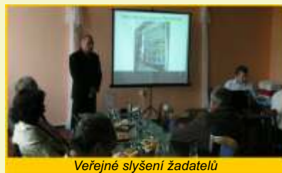
Veřejné slyšení žadatelů

představili přítomným členům komise, členům MAS a všem dalším zájemcům své projekty. Jednotliví členové Výběrové komise pak vyhodnotili podané Žádosti a přiřadili jim počet bodů dle naplnění jednotlivých preferenčních kritérií. Opírali se přitom o Metodický pokyn pro hodnocení projektů a také o informace z předcházejícího školení členů komise. Pro bodování preferenčních kritérií Dopad projektu na mládež do 30 let a Dopad projektu na ženy jim byl doporučením návrh Poradních skupin mládež resp. ženy. Na svém 2. zasedání dne 7. října komise stanovila a schválila pořadí projektů dle udělených bodů a zároveň určila 3 náhradníky pro případ, že by byl některý místní akční skupinou doporučený projekt vyřazen v průběhu kontrol na RO SZIF. Programový výbor byl na své schůzce 9.10. seznámen s navrhovaným pořadím projektů, které odsouhlasil s tím, že přesunul nevyčerpanou alokaci z Fiche č.1 do ostatních třech Fichí, tak aby přidělené alokace co nejlépe odpovídaly požadovaným částkám. Definitivně tak bylo schváleno pořadí projektů doporučených k realizaci s příslušnými částkami přidělené dotace. Jeden žadatel ve Fichi č.6, kterému mohla být přiznána už pouze zbylá část alokace, pak byl osloven, zda bude svůj projekt realizovat i s poníženou částkou dotace, na což žadatel přistoupil.