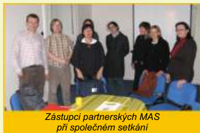
Zástupci partnerských MAS při společném setkání

ve spolupráci všech partnerů připravena Žádost o dotaci z Programu rozvoje venkova ČR – Opatření IV.2.1. Realizace projektů spolupráce, kde se Rozvojové partnerství ujalo role Koordinační MAS. Žádost bohužel nemohla být v listopadovém termínu kvůli jedné formální chybě přijata. Projekt je tak připraven se ucházet o získání dotace v příští Výzvě PRV. Třetí oblastí spolupráce je pak společný postup při sebeevaluaci a vzájemné evaluace dosavadního průběhu realizace SPL u jednotlivých partnerů. Na společné schůzce 3. prosince v Praze vznikl jednotný sebeevaluační dotazník, který budou MAS každoročně vyplňovat. Každá MAS pak externě vyhodnotí jednu partnerskou MAS, kdy jí na základě vyhodnocení dotazníku, cílů SPL, nastavení Fichí apod. může dát cennou „vnější“