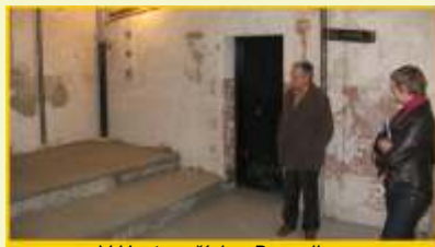
V Hustopečích n.B. vznikne nová místnost pro hudební spolky

Pracovníci MAS ve dnech 21. a 22. října osobně navštívili místa realizace doporučených projektů, aby se přesvědčili o pravdivosti údajů uvedených v Žadostech a na setkáních se žadatelé je informovali o dalším průběhu administrace jejich Žadostí. Kancelář MAS také poskytla v listopadu 2008 zájemcům z řad nedoporučených žadatelů osobní konzultace, na kterých jim sdělila slovní komentáře, které doprovázely hodnocení jednotlivých členů komise.