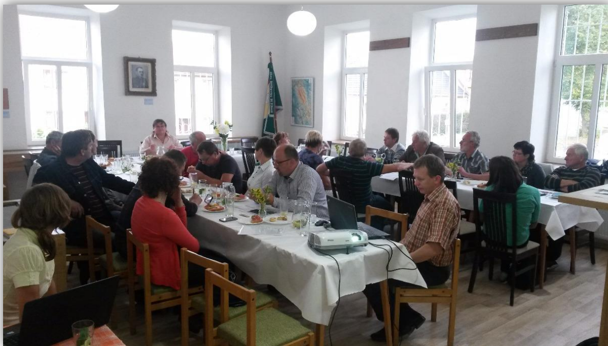
Zasedání Valné hromady MAS Hranicko v Býškovcích dne 23. 9. 2015