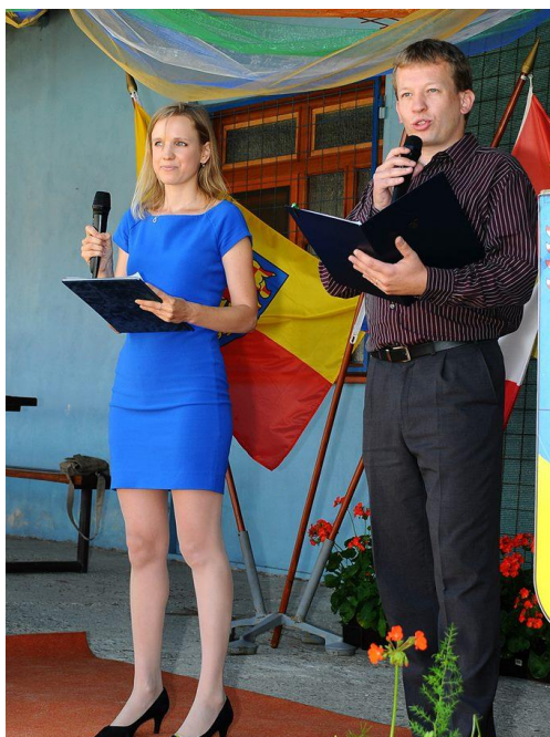
Akce Vesnice roku Olomouckého kraje v Černotíně