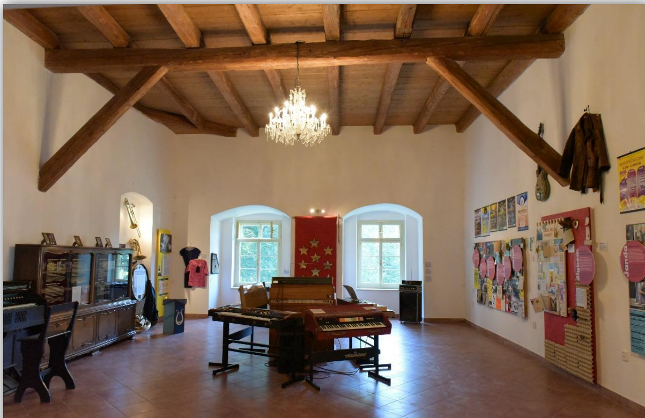
Prostory hudebního muzea na zámku v Hustopečích nad Bečvou

různým fenoménům hudební historie Hranicka i samotných Hustopeč nad Bečvou. K dispozici je také sada elektrofonických varhan a dalších nástrojů, na které si mohou návštěvníci i zahrát. Interaktivními prvky jsou prohlídka Digitálního hudebního archivu a možnost poslechu číslovaných audiokázek do sluchátek vlastního telefonu. Filmová místnost je postavena na výstavě historické promítací techniky a velkoplošné projekci digitálního filmového archivu historických záznamů z regionu ( www.filmovemuzeum.cz ). Po náročné stavební přípravě bylo muzeum slavnostně otevřeno 19. 6. 2015, další otevření proběhlo během Hustopečských dnů poslední srpnový víkend.