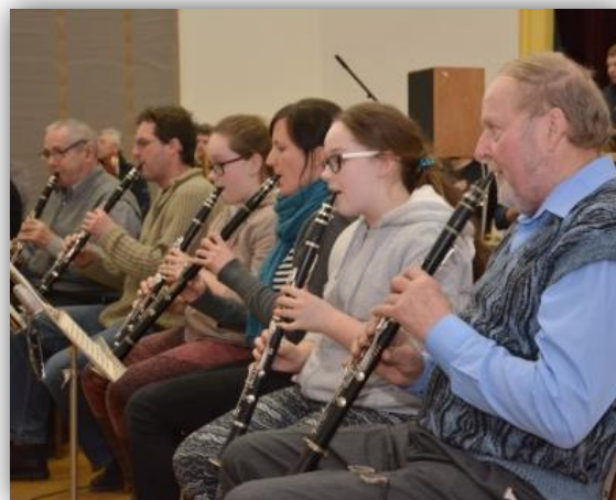
Momentky z konání odborné konference a společné nahrávání dvou dechových souborů