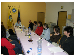
Veřejné projednání se spolkem žen v Klokočí