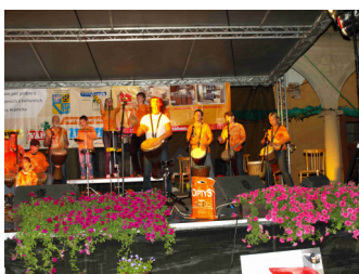
Akce Hustopečské dny 2008 byla také podpořena z Grantového programu

Grantový program regionu Hranicko vznikl v roce 2008 jako pilotní projekt na základě spolupráce Mikroregionu Hranicko, Hranické rozvojové agentury a významných firem na Hranicku. Program otestoval spolupráci zapojených subjektů za účelem nalezení nové formy podpory kulturních a sportovních akcí na Hranicku s cílem obohatit nabídku kvalitních kulturních a sportovních akcí a zvýšit jejich kvalitu. V roce 2008 se do programu zapojili Cement Hranice a.s., SSI Schäfer s.r.o., Váhala a spol. s.r.o., ŽELEZO HRANICE s.r.o. Celkem bylo v roce 2008 podpořeno 16