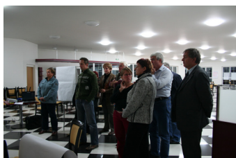
Schůzka Místní akční skupiny Na cestě k prosperitě

Aktivita mimo region Hranicko pomáhaly k přípravě regionů na využití programu LEADER. Konkrétně se jednalo o práci na záměru Místní akční skupiny Severní Chřiby a Pomoraví pod názvem „Ruce hlavy dohromady pro Chřiby a Pomoraví“ do programu LEADER ČR 2008.