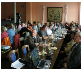
Veřejné slyšení žadatelů v 1. výzvě LEADER „Měníme Hranicko“

Hranická rozvojová agentura je externím poradcem pro MAS Rozvojové partnerství regionu Hranicko při realizaci dotačního programu „Měníme Hranicko“. Tuto funkci vykonává od července roku 2008 na základě smlouvy schválené orgány MAS. Poradenství spočívá ve výkonu funkce facilitátora, poskytování pravidelných konzultací, v koordinaci vyhodnocování činnosti MAS a v průběžných aktualizacích Strategického plánu LEADER a Strategie rozvoje regionu Hranicko. Je na místě vysvětlit, co tyto na první pohled záhadná sousloví znamenají.