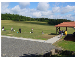
Golfové hřiště na Radíkově